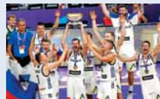
Novi evropski prvaki

KOŠARKA. Na 40. evropskem prvenstvu je slovenska košarkarska reprezentanca v tem športu prvič osvojila medaljo, in to kar zlatega leska. Slovenski košarkarji niso izgubili niti ene tekme, premagali so vseh 9 nasprotnikov. Po skupinskem delu tekmovanja so v osmini finala najprej ugnali Ukrajino, v četrtfinalu Latvije, v polfinalnem obračunu pa so za 20 točk nadigrali branilce naslova Špance in si finale v Carigradu v Turčiji več kot zaslužili. Na finalni tekmi so bili boj z reprezentanti Srbije in jih s srčno in borbeno igro ob močni podpori kar 6.000 slovenskih navijačev in kljub poškodbi Luke Dončiča v tretji četrtini premagali s 93:85.