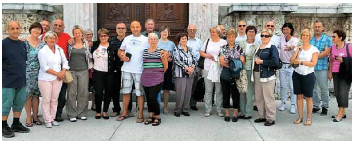
Planinsko romarska sveta maša se često zaključí pri Mariji na Brezjah.