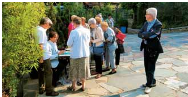
Prvi romarji so prišli že dobro uro pred evharistično daritvijo.