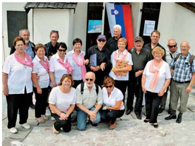
Zarjine pevke, nekaj Fantov z vasi in kvartet klarinetistov