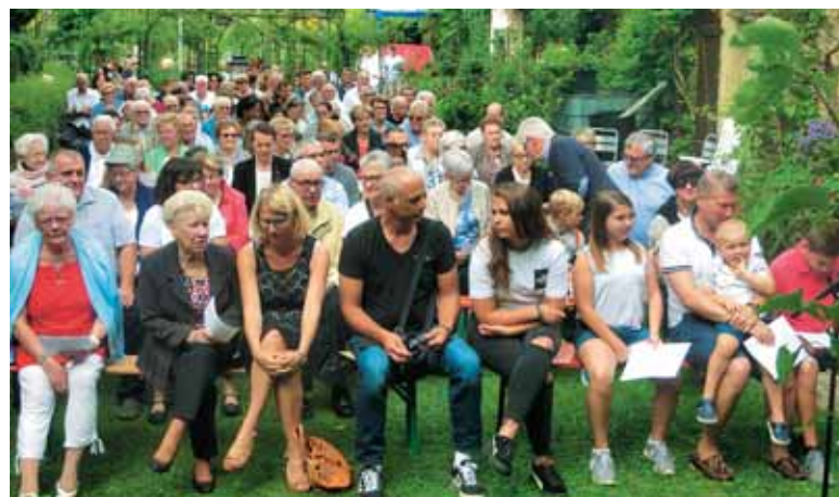
Tem, ki so prišli iz Anglije, Korzike, Nice in okoliških mest ter vasi, veliki šmaren v mlinu veliko pomeni.