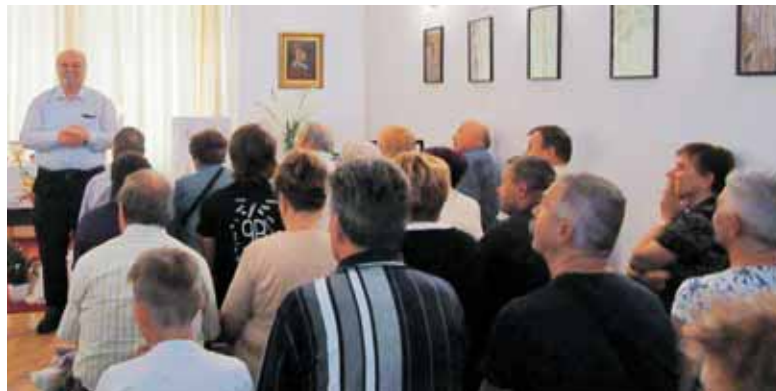
Po maši kratka predstavitev Münchenske župnije

prostora, da jim postrežemo in se primerno okrepijo na poti do Berlina, kamor so bili namenjeni? Vsa ta vprašanja smo rešili vsaj zasilno pa vendar zadovoljivo. Tako so pokomentirali v večini naši obiskovalci, ko so odhajali iz župnijskega doma. Nekaj izrednih organizacijskih zahtev smo jim naložili, da so prišli vsi v kapelo, da so po koncu maše našli vsak svoje mesto v enem od prostorov, kjer so sodelavci ponudili gostom klobaso in kruh, kumarice in senf. Bili so pošteno lačni, saj je vožnja od zgodnjih jutranjih ur do nas dodobra porabila vse, kar so zaužili pri zajtrku, kolikor so ga sploh imeli. Tako so na glas hvalili kranjske klobase in bili zadovoljni s skromnim udobjem, ki smo jim ga lahko nudili.