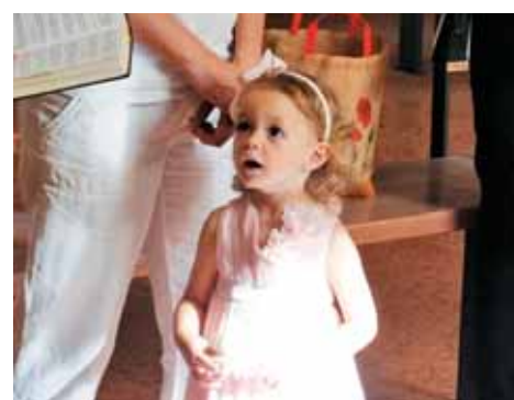
Sveti krst odpira oči srca za čudoviti svet božjega kraljestva.