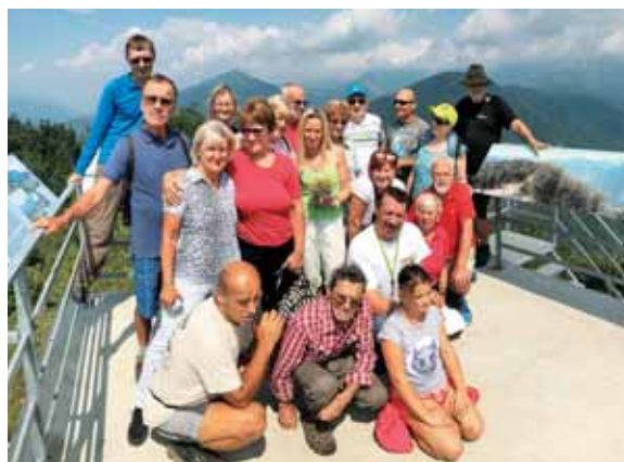
Ena gasilska s švedsko-slovenskega vandravanja