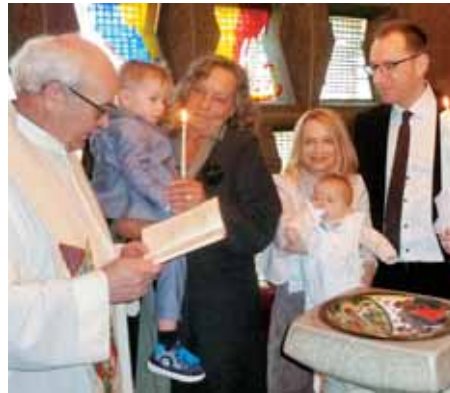
Krst Victorie Ziehr v Hildnu