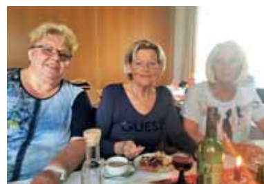
Naše nemške prijateljice, ki prihajajo k naši maši in srečanjem.