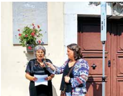
Vir: novice iz Kobarida