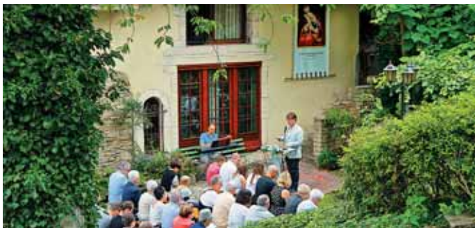
Skrbno pripravljenu liturgičnemu petju je sledila molitev, ki je odmevala v francoskem in slovenskem jeziku.