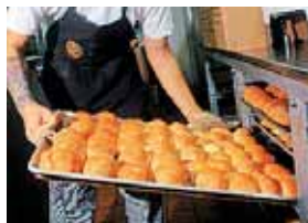
E A P R A K N