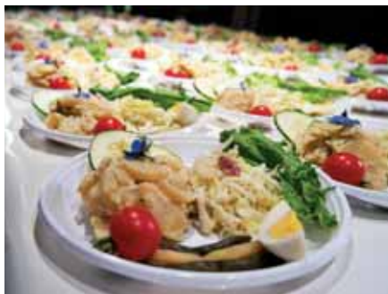
128 slovenskih krožnikov predjedji že čaka samo še na toplo prekajeno klobaso.