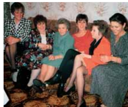
S petimi hčerkami