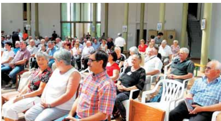
Srečanje v moji domovini 2017

z drugimi in poleg drugega. Tako so torej tudi individualna stvarnost mojega obhajila in bivanja in življenja Cerkve neločljivo povezane druga z drugo. Cerkev se ne rojeva kakor preprosta zveza občestev. Cerkev se rojeva iz enega kruha, enega Gospoda in izhajajoč od njega je že od samega začetka ter povsod ena in edina, eno telo, ki izhaja iz enega kruha.« Obhajanje evharistije, udeležba pri mašni daritvi je za kristjana najbolj osrečujoče dejanje in življenjskega pomena. Zato je kristjan v prvi vrsti »evharističen človek«. Cerkev se nahaja tam, kjer se kristjani zbirajo okrog oltarne mize in obhajajo mašno daritev. Na ta središčni pomen evharistije je želel spomniti pokojni papež Janez Pavel II. ob letu evharistije. Že prvi kristja-