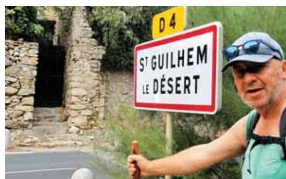
Ena od pomembnih postaj romarjev v Kompostelo, opatijska cerkev St. Guilhem, ki je bil sorodnik Karla Velikega.