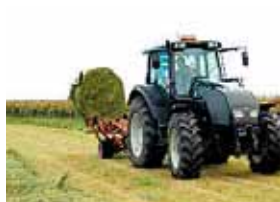
M K T E I A J