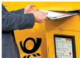
A P T O Š