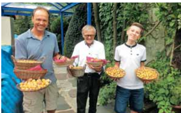
Po siru se je nasmehnila kraljica vseh sadežev Lorene, rdečelična slastna mirabela.