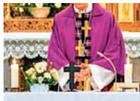
E R C K V E