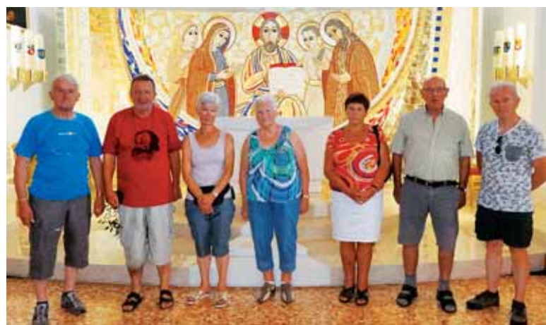
Odbor zbora Slomšek pri oltarju mučenca Alojzija Grozdeta v romarski cerkvi na Zaplazu