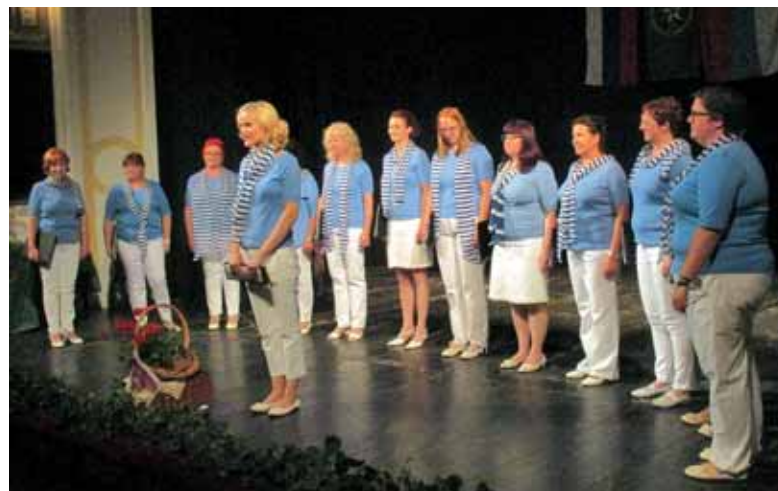
Ženska vokalna skupina Brinke iz Grosupljega je bila častni gost prireditve.

otroške predstave »Poezija igrarija«, ki je nastala v sodelovanju z mladimi udeleženci dopolnilnega pouka slovenskega jezika in kulture v Zrenjaninu ter v mesecu aprilu prejela posebno pohvalo na Otroškem gledališkem festivalu v Ljubljani. S predstavo so se učenci predstavili tudi na prireditvi »Naša slovenska beseda« ter poželi navdušen aplavz.