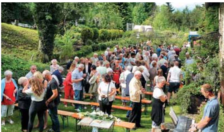
Od evharistične mize se selimo pod šotore in brajde prijateljstva.