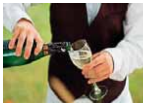
S E A R V T R A J I C A