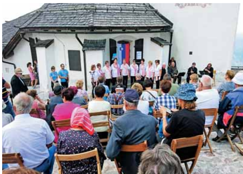
Pevke skupine Zarja iz Ajdovščine so pele tudi po maši.