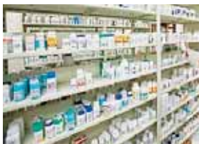
K A E L A R N