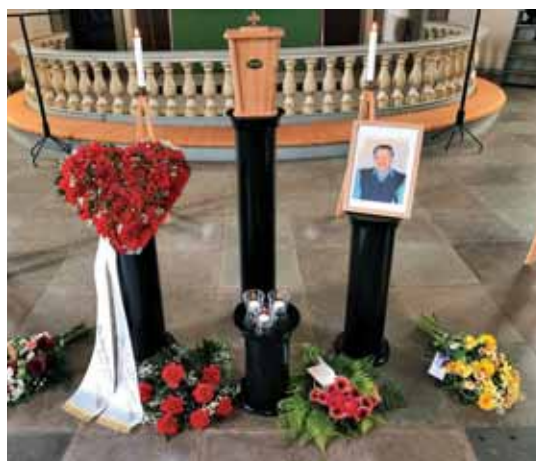
Slovo od pokojnega Ferdinanda Zakrajška iz Alsterma