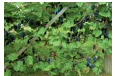
Lojzetova brajda 2017 v Eisdu v Belgiji