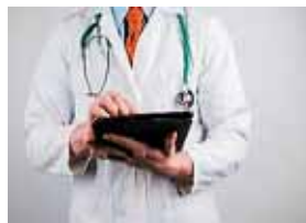
O N B L Š I I N A C