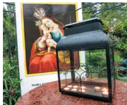
Z Njo se je pričelo srečanje in se zaključilo ob Njej v objemu večerne molitve.