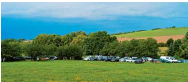
Prostrani pašnik pred mlinom je na veliki šmaren postal parkirišče za jeklene konjičke.