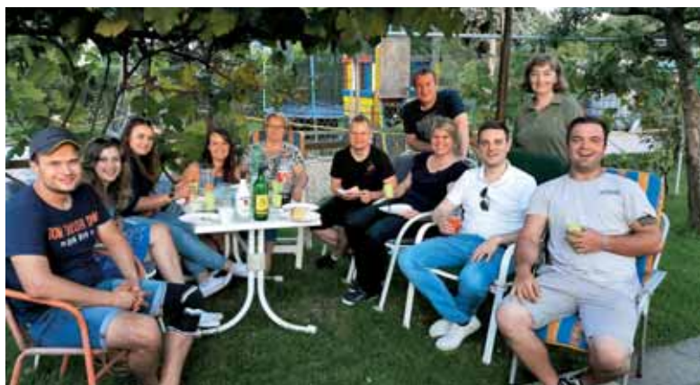
Z mladimi župljani na vrtu

na rane; da se izčrpam zate, ne da bi iskal drugo plačilo kakor zavest, da sem izpolnil tvojo sveto voljo. Amen.« Aleš Kalamar