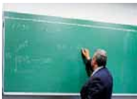
O Š L A