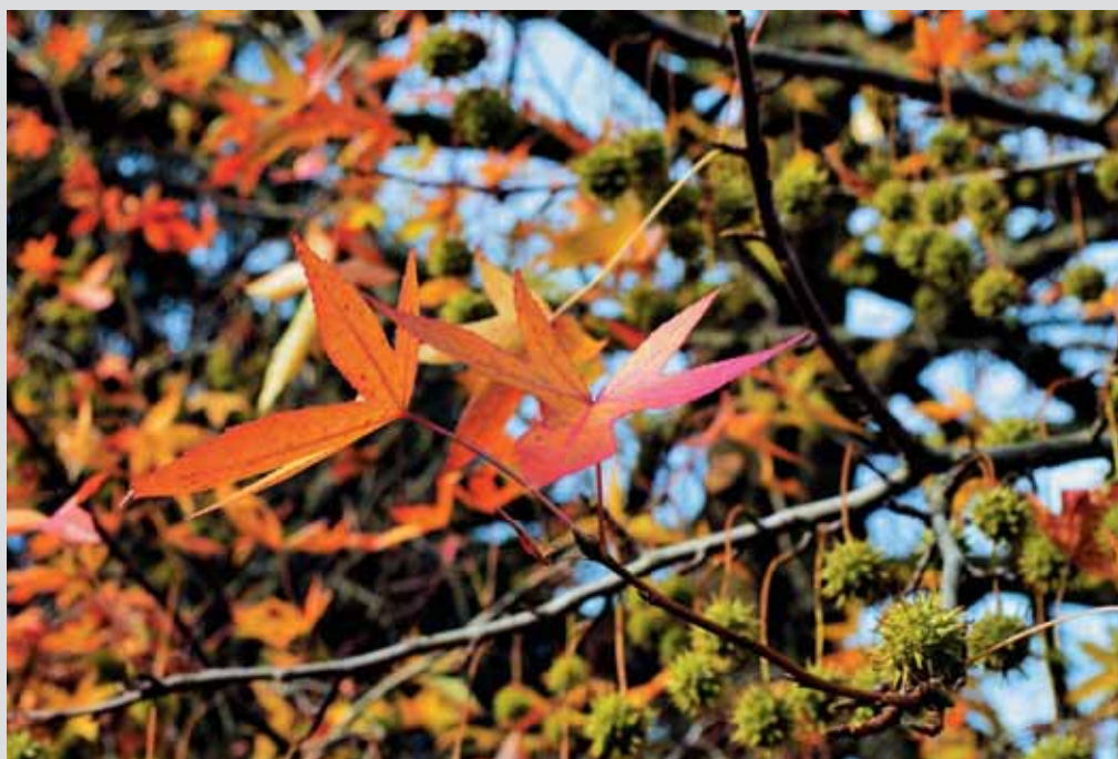
Jesenske barve