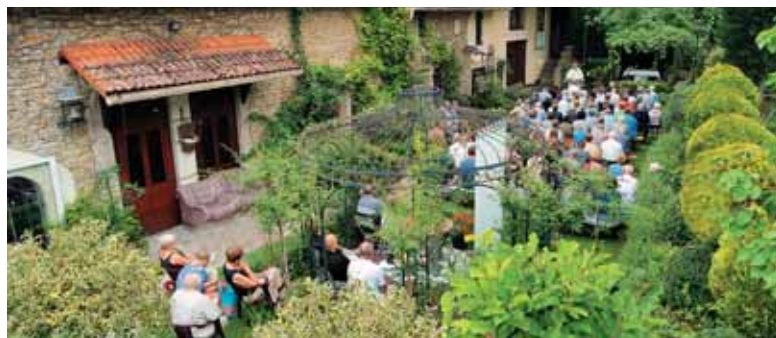
Ptičja perspektiva na dvorišče starega mlina, kjer so se stoletja zvrščale vreče žita in moke.