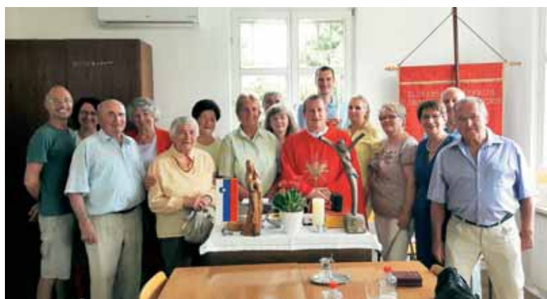
Slovensko župnišče zbira Slovence.