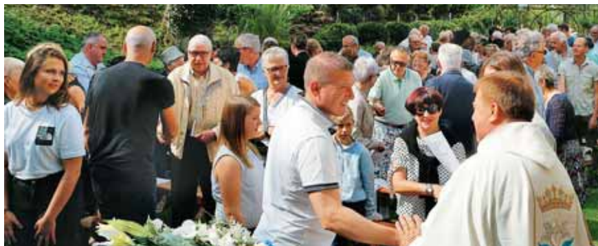
Naš duh se je radoval v Bogu, ko smo si izmenjali Marijin in Elizabetin pozdrav.