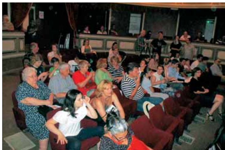
Gledalci so pozorno spremljali nastopajoče skupine.

zboru Brinke in Planika. Vsekakor smo lahko veseli, da se slovenska pesem sliši v tukajšnjih krajih in da je nagovorila tudi širšo javnost.