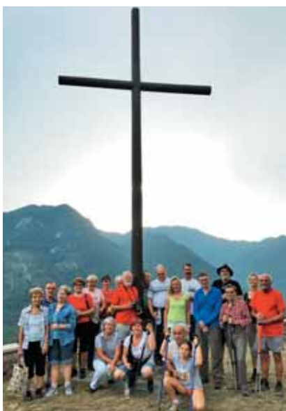
Mengore, zaključek nedeljskega vandranja