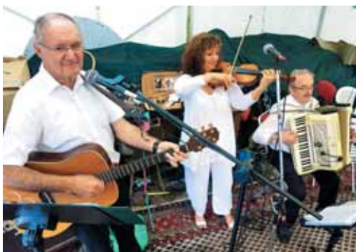
Orkester Jadran je popestril prijateljsko mizo z mednarodnimi melodijami.