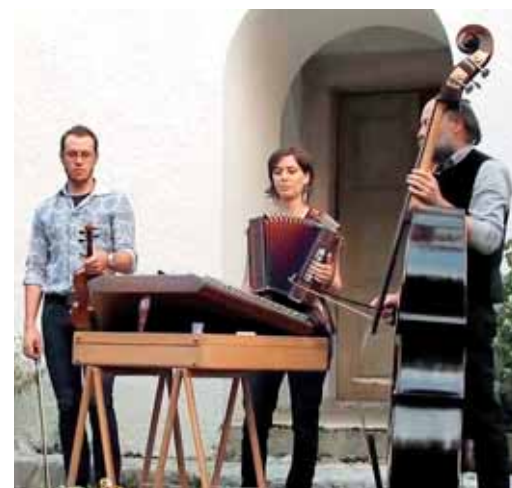
Družinski trio Volk folk

V četrtek, 9. novembra, bo o življenju in delu slovenskih beguncev po letu 1945 predavala dr.