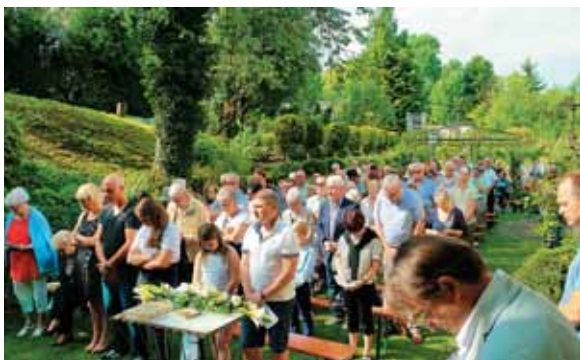
Globok in spoštljiv poklon Najsvetejšemu v podobi kruha življenja