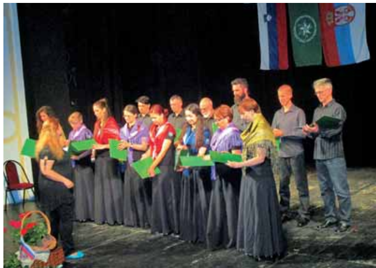
Domači pevski zbor Planika iz Velikega Bečkereka