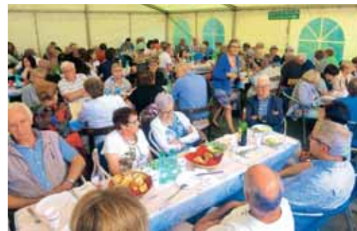
Tudi pod velikima šotoroma, kjer smo delili romarsko kosilo, je bilo tesno s prostorom.