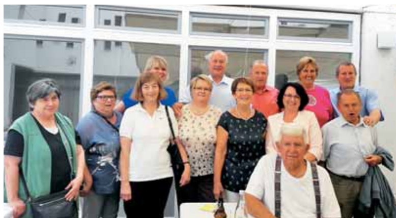
Druženje pri župnijski cerkvi