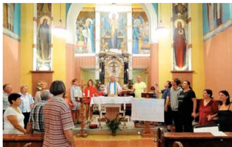
Med molitvijo očenaša pri nedeljski maši v Soči